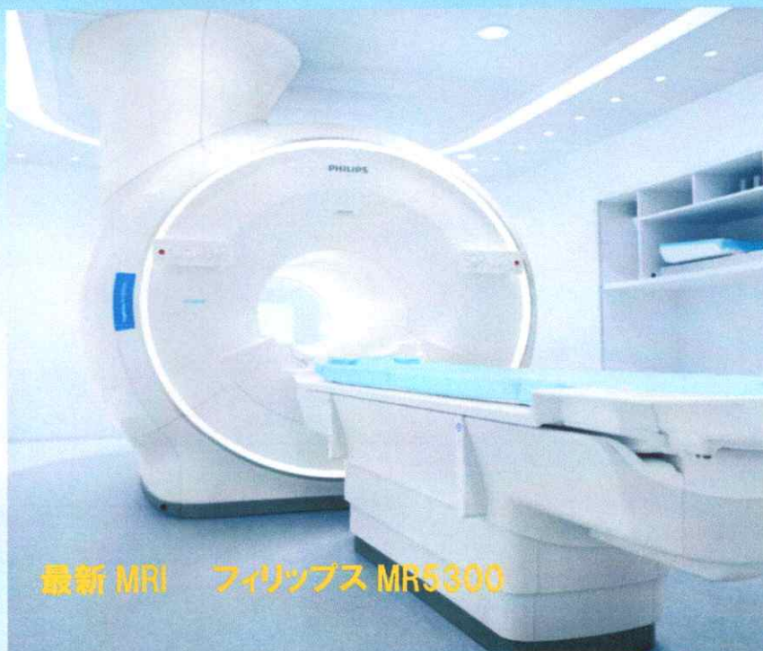
最新 MRI フィリップス MR5300