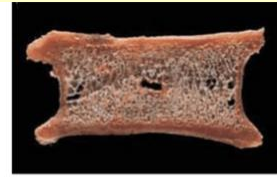
正常な背骨の断面図